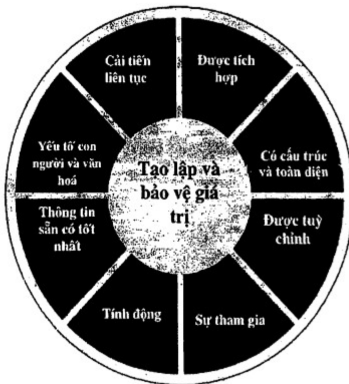
Hình 2 - Nguyên tắc

này là nền tảng cho việc quản lý rủi ro và cần được xem xét khi thiết lập khuôn khổ quản lý rủi ro và các quá trình quản lý rủi ro của tổ chức. Những nguyên tắc này cần cho phép tổ chức quản lý ảnh hưởng của sự không chắc chắn tới các mục tiêu của mình.