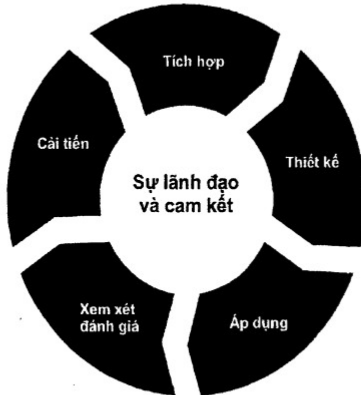
Hình 3 - Khuôn khổ

Các thành phần của khuôn khổ quản lý rủi ro và cách thức các thành phần này cùng hoạt động cần được tùy chỉnh theo nhu cầu của tổ chức.